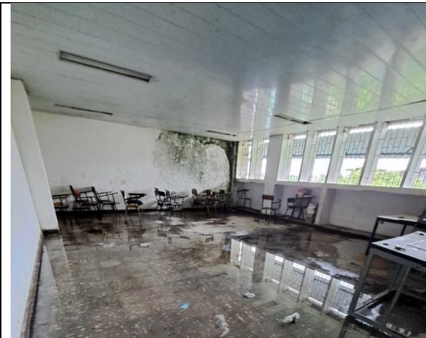
Estado inicial de aulas