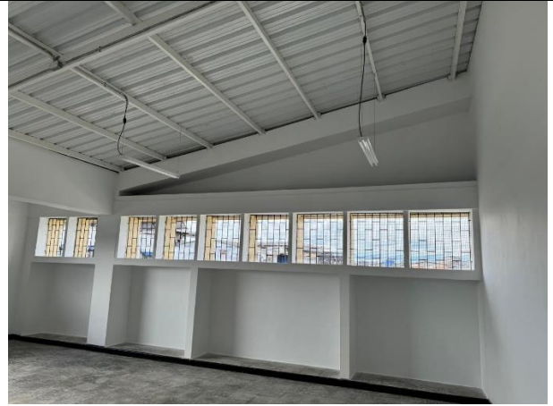
Adecuación aulas existentes bloque A