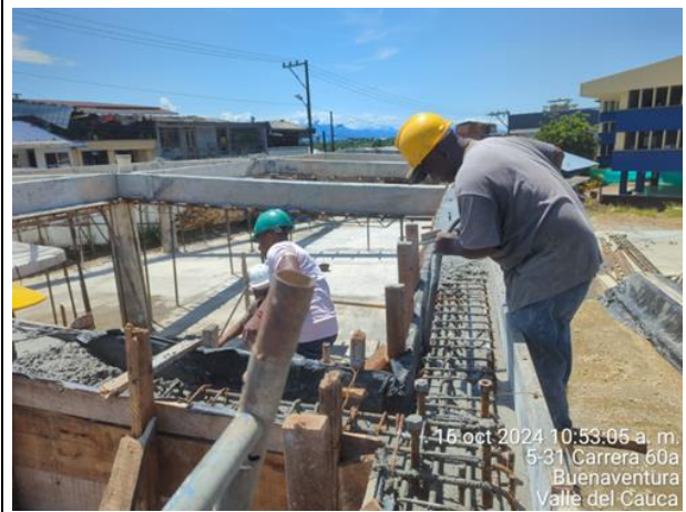
Armado y fundida ce vigas aéreas bloque de aulas