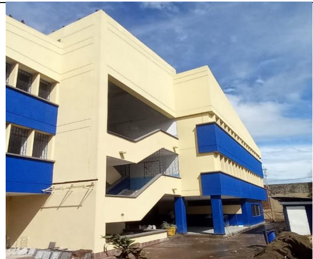
Adecuación fachada existente bloque A