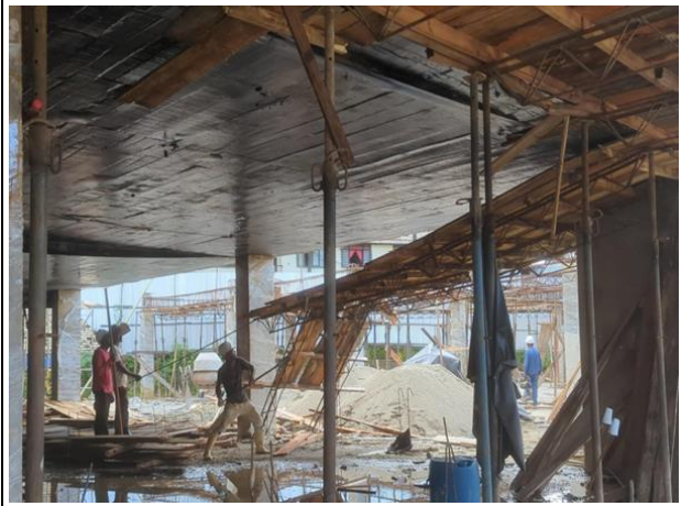
Desencofre de place de entrepiso bloque de aulas