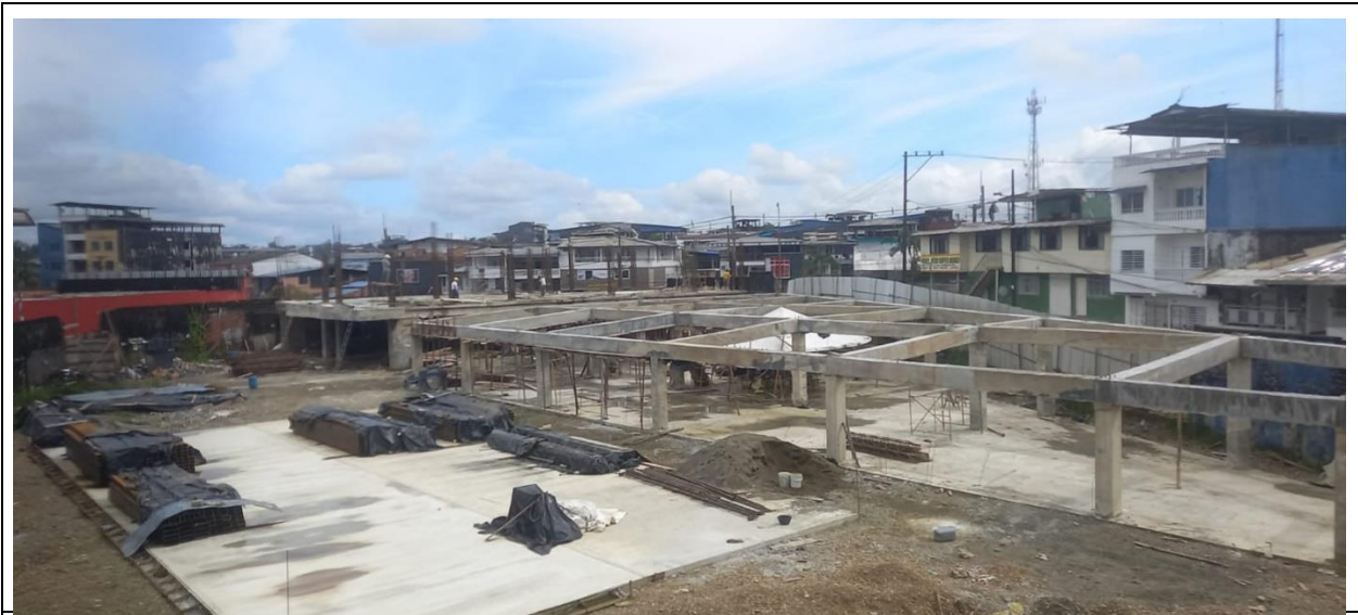
Vista general del estado de la obra al 30 de octubre de 2024