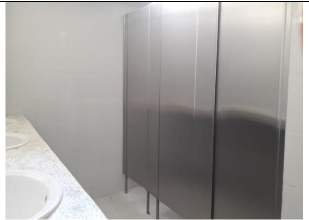
Adecuación baños existentes bloque A

De otra parte, se avanza en el mejoramiento de los bloques B y C de la infraestructura existente con la restauración de la fachada, reparación de escaleras, instalación de baldosas de gres, mantenimiento de pisos y estuco y pintura de muros de circulaciones internas. La entrega del mejoramiento de estos bloques se tiene prevista para el mes de noviembre de 2024, puesto que se han tenido retrasos en su ejecución por las lluvias y ausencia de personal por dificultades de orden público, esta situación ha sido informada a la comunidad educativa en las socializaciones realizadas.