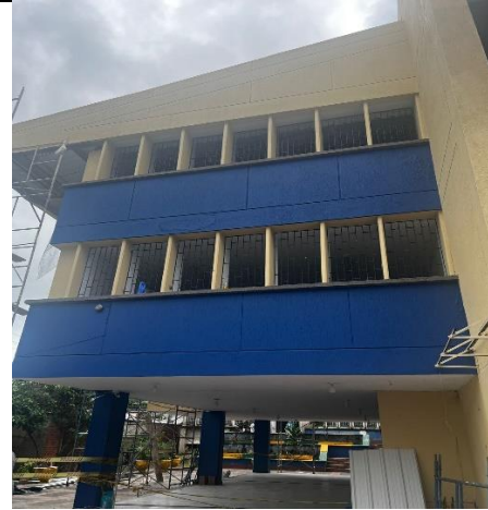
Adecuación fachada existente bloque A