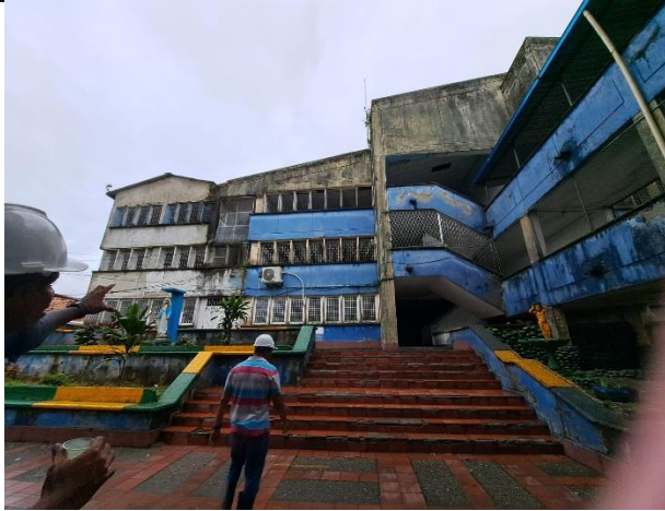
Estado inicial fachada