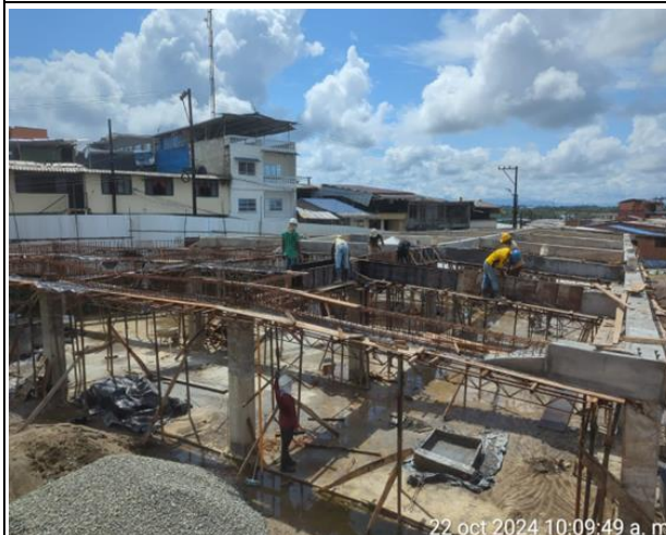
Armado y fundida ce vigas aéreas bloque de aulas