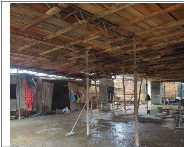
Desencofre de place de entrepiso bloque de aulas