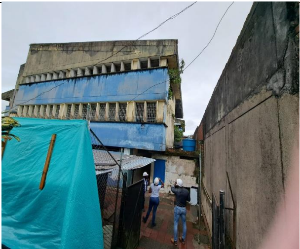
Estado inicial fachada