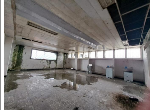
Estado inicial de aulas